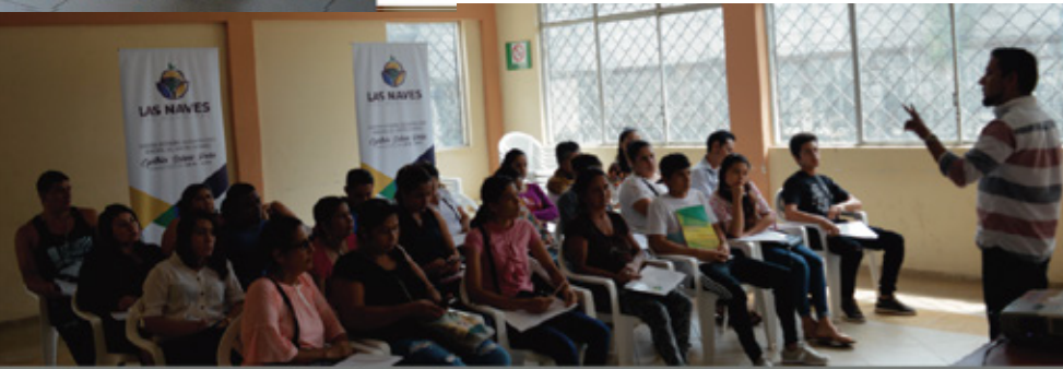
Prefectura de Bolívar - Planes de Negocio y Emprendimiento desde Cero