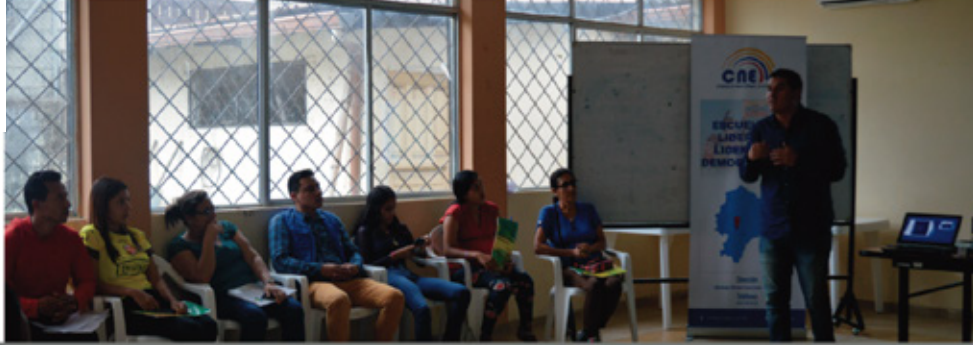
CNE Bolívar - Escuela de Formación de Líderes del cantón Las Naves