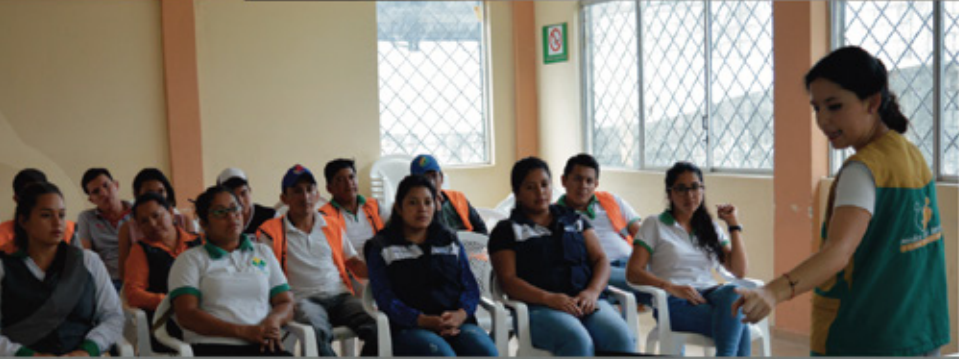
Centro de Salud Las Naves - Capacitación en Primeros Auxilios