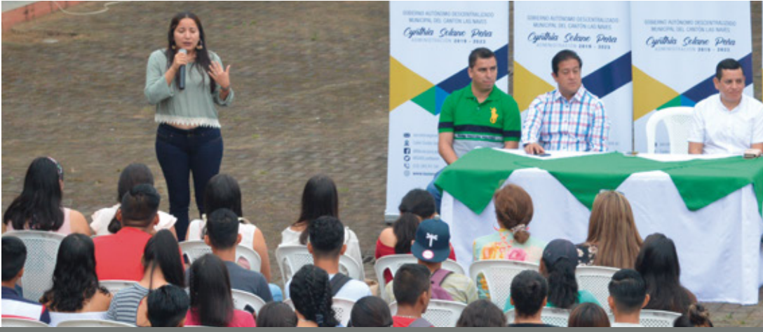
Gestión con la Universidad de Bolívar para realizar cursos de nivelación para el ingreso a la Universidad