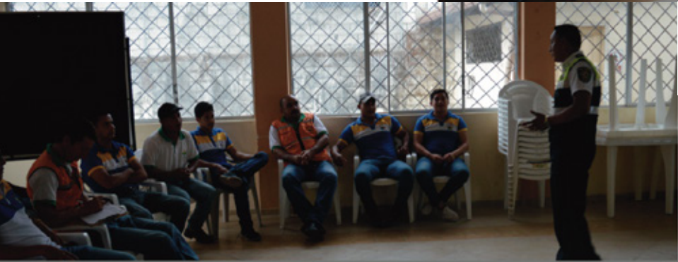
CTE capacita a servidores municipales - Educación y Seguridad Vial